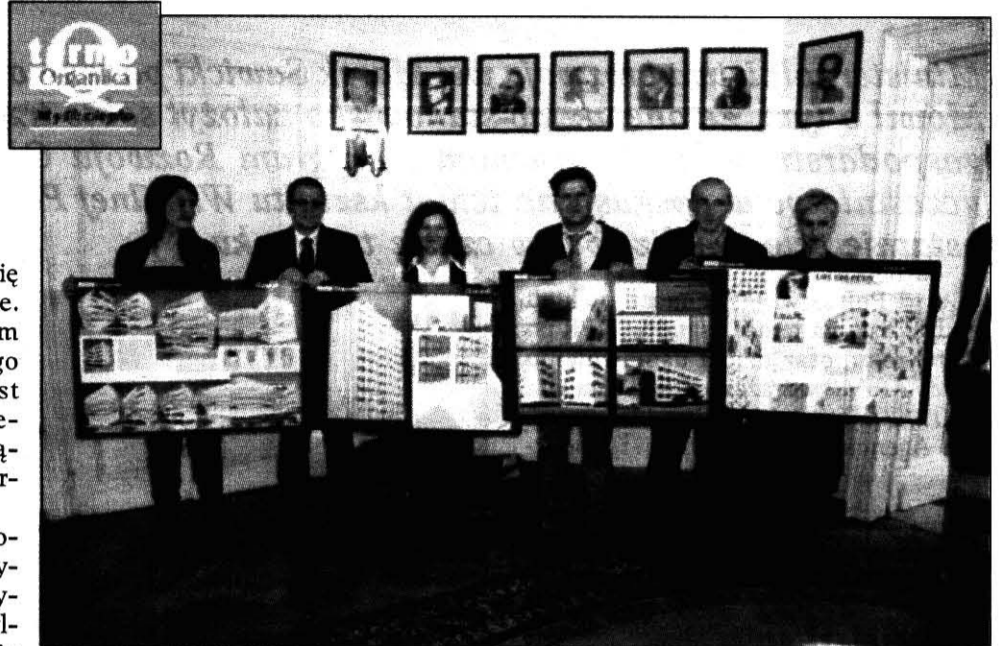
Nagrodzone prace prezentują ich twórcy

przeznaczone i montowane w całości lub fragmentarycznie na innych budynkach.