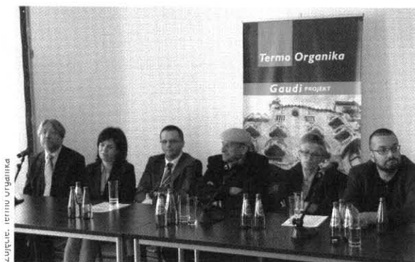
Jury konkursu na projekt fasady budynku

Chociaż konkurs jest przeznaczony głównie dla artystów, architektów i studentów tych dziedzin, może wziąć w nim udział każdy i wygrać cenne nagrody. Jest to szansa dla wizjonerów, którzy mają oryginalne pomysły. W polskich realiach odważne projekty architektoniczne często lądują w szufladach. Organizator czeka na pomysły na miarę Gaudiego, Eiffela czy Dalego i ma nadzieję, że dzięki konkursowi powstaną niezwykle budynki